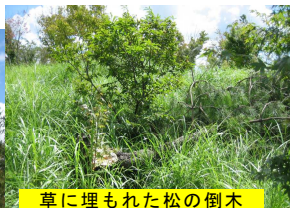
草に埋もれた松の倒木