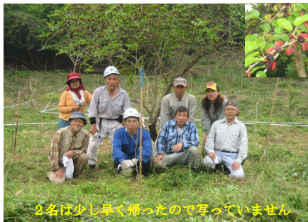
2名は少し早く帰ったので写っていません