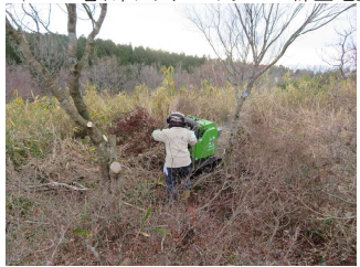
12/11(臨時) 亀石山 除伐枝の粉砕