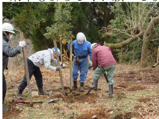
1/16 市有林(南老兼) クヌギ植樹