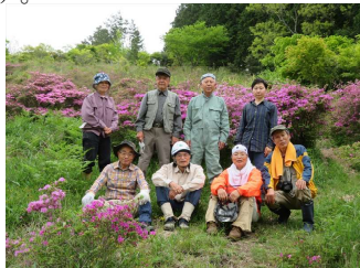
5/15 亀石山ミヤマキリシマ群生地整備